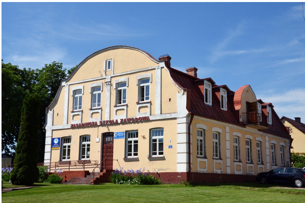
Zdjęcie nr 8. Dawny dom talmudyczny w Siemiatyczach