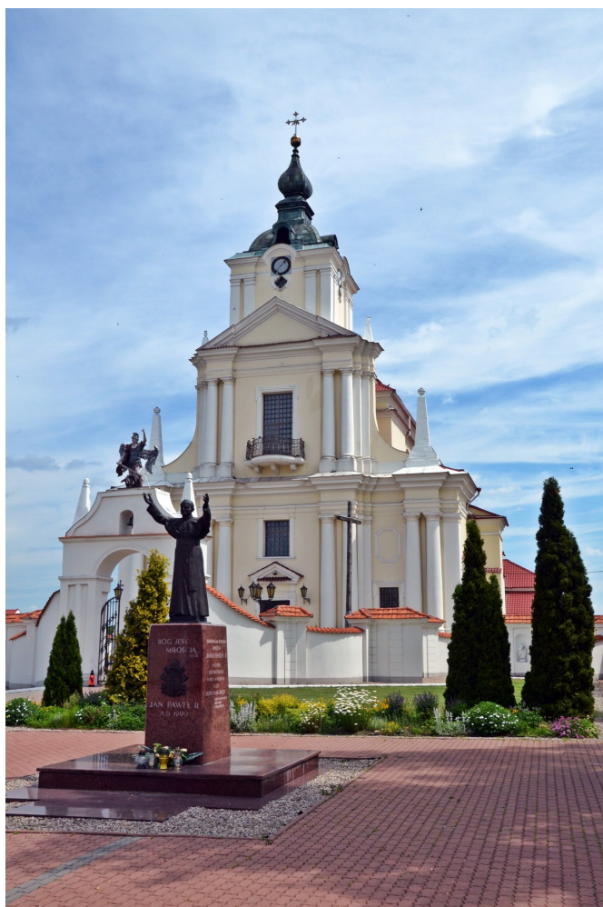
Zdjęcie nr 5. Kościół p.w. Wniebowzięcia Najświętszej Maryi Panny w Siemiatyczach

Budynek kościoła należy do najpiękniejszych w Diecezji Drohiczyńskiej. Budowę rozpoczął w 1626 roku Leon Sapieha, a ukończył ją w 1637 roku jego syn Kazimierz Leon Sapieha. Konsekrowany w 1638 roku. Usytuowany we wschodniej części miasta, za północno – wschodnim narożem rynku. Przyjął formę bazyliki z kwadratową wieżą, na której znajduje się zegar. Kolejne rozbudowy i uzupełnianie wyposażenia miały miejsce w latach 1713 – 1737. Po pożarze w 1754 roku budowano nowe sklepienia w nawach bocznych. W czasie I i II wojny światowej kościół nie doznał większych uszkodzeń.