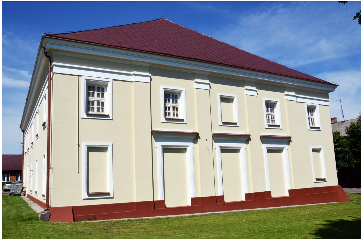
Zdjęcie nr 7. Dawna synagoga w Siemiatyczach

przez pożar. W okresie okupacji obiekt pełnił funkcję magazynu, w 1944 roku cenne wyposażenie synagogi zostało zniszczone. Po II wojnie światowej w budynku synagogi powstał dom kultury. W latach 1961-64 przeprowadzono generalny remont zamalowując min. freski ścienne.