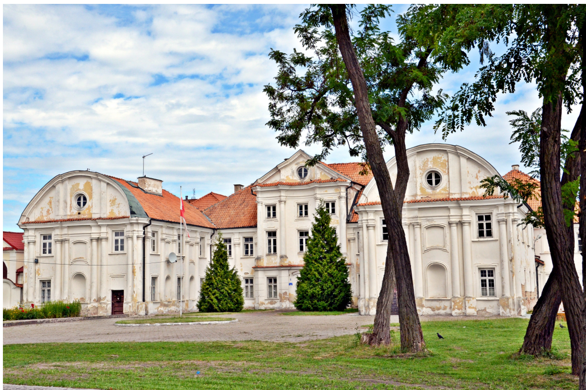
Zdjęcie nr 4. Dawny zespół klasztorny misjonarzy w Siemiatyczach

Zabytek, który w swoim kształcie i pałacowym założeniu architektonicznym nawiązuje do najlepszych europejskich wzorów późnego baroku. Elewacja budynku posiada niezaprzeczalną unikalną wartość architektoniczną, gdyż należy do nielicznej w Polsce grupy fasad kolumnowych. Dziedziniec pałacu otoczony jest murem, w którego faliste ściany wkomponowane były dzwonnice.