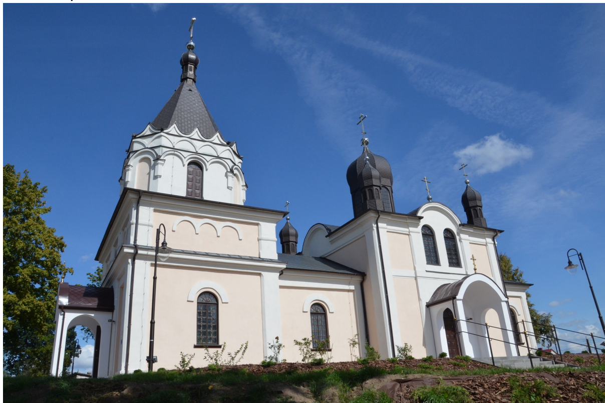
Zdjęcie nr 6. Cerkiew p.w. św. Apostołów Piotra i Pawła w Siemiatyczach

budownictwa cerkiewnego drugiej połowy XIX wieku, wraz z ogrodzeniem, stróżówką i cmentarzem przycerkiewnym tworzy unikalny zespół o dużych walorach architektonicznych i kulturowych.