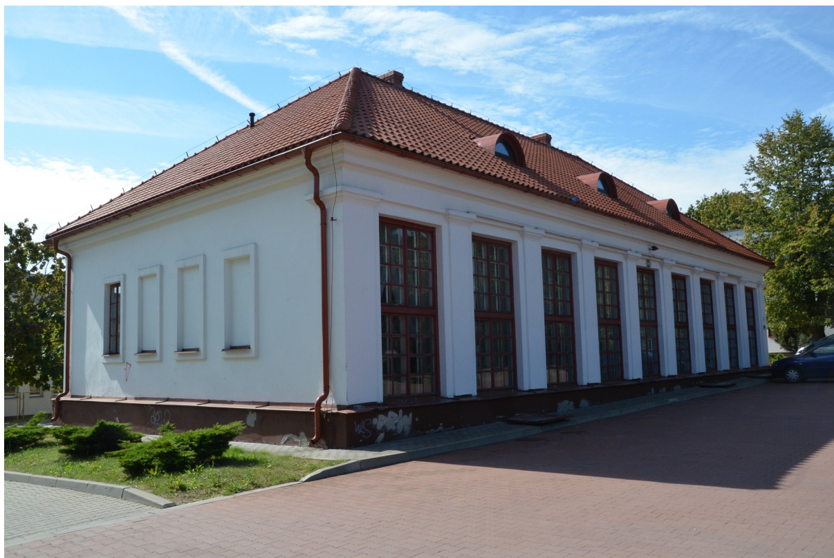
Zdjęcie nr 1. Dawna oranżeria w Siemiatyczach

Fragment po pałacu księżnej Anny Jabłonowskiej tzw. dom ogrodnika. Zbudowana w XVIII – XIX wieku na planie prostokąta, murowana, z cegły i kamienia, tynkowana, parterowa, dwutraktowa, podpiwniczona, wewnątrz przykryte sufitami, dach dwuspadowy, kryty dachówką esówką. Zniszczona, a następnie odbudowana jest doskonałym przykładem budownictwa gospodarczego z przełomu wieków XVIII- XIX.