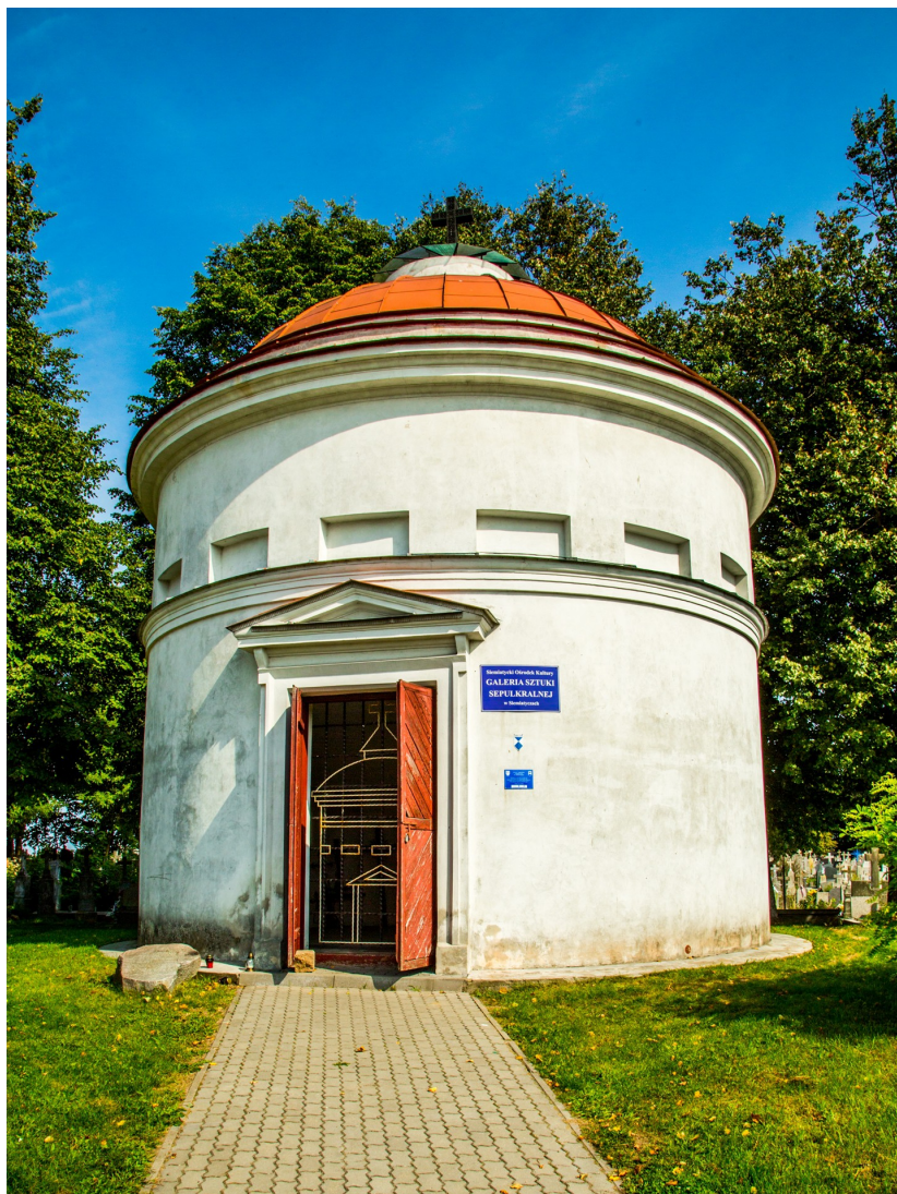
Zdjęcie nr 3. Kaplica cmentarna ewangelicka w Siemiatyczach

Domniemane dzieło architekta Szymona Bogumiła Zuga. Usytuowana na terenie dawnego cmentarza ewangelickiego. Zbudowana ok. 1800 roku.