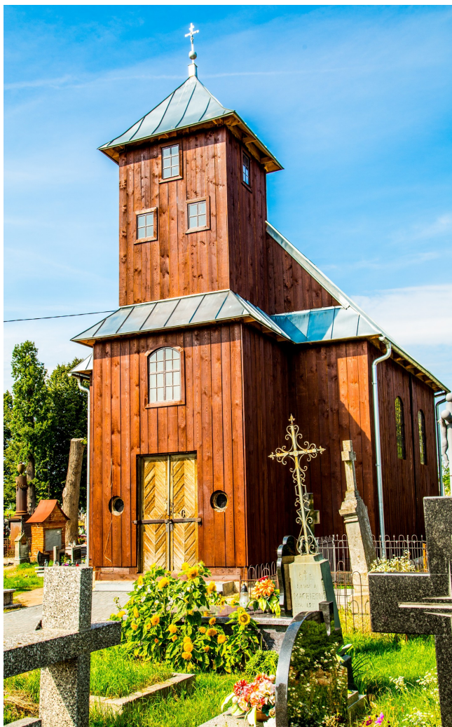
Zdjęcie nr 2. Kaplica cmentarna pw. św. Anny w Siemiatyczach

Zbudowana w latach 1826-1827 roku na planie prostokąta o silnie ściętych narożach w części prezbiterialnej. Drewniana, konstrukcja zrębowa, oszalowana, jednonawowa bez wyodrębnionego prezbiterium z dwukondygnacyjną kwadratową wieżą.